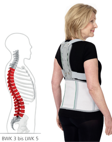
BWK 3 bis LWK 5

Die beiden an der Rückenplatte befestigten Schultergurte richten die Wirbelsäule auf und entlasten dadurch die Brustwirbelsäule. Das breite Leibteil bewirkt eine Entlordosierung der Lendenwirbelsäule und entlastet somit diesen Bereich. Die Reklinationsgurte werden über zusätzliche seitliche Gurte mit dem Leibteil verbunden. Dadurch wird eine Rotationseinschränkung erreicht.